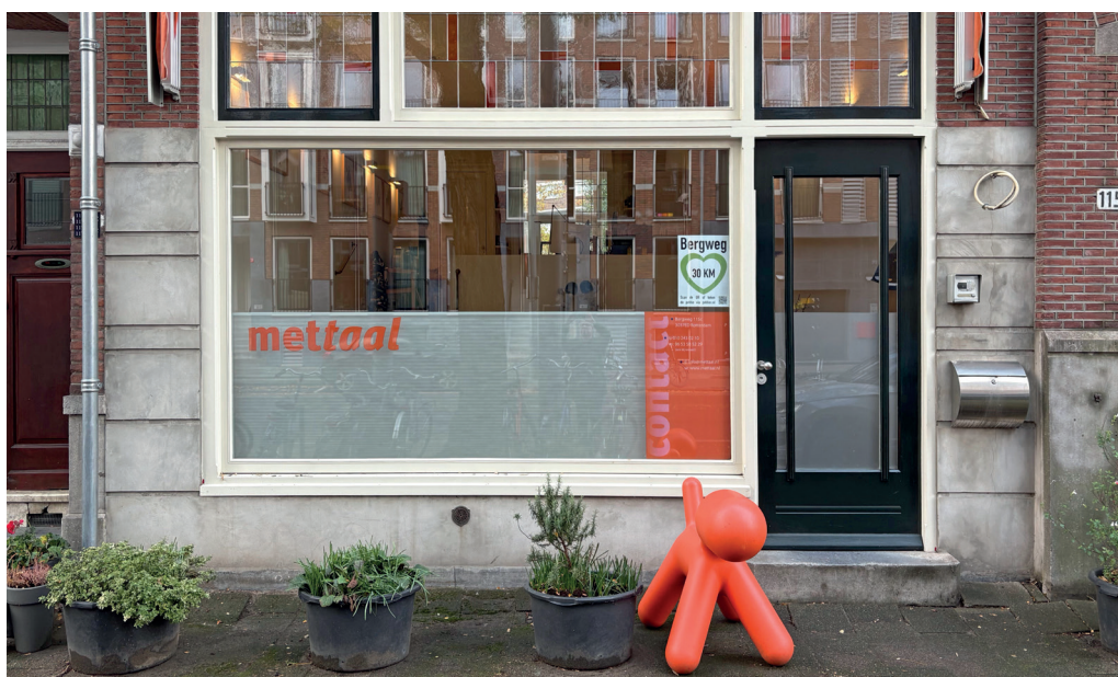
De etalage van Mettaal